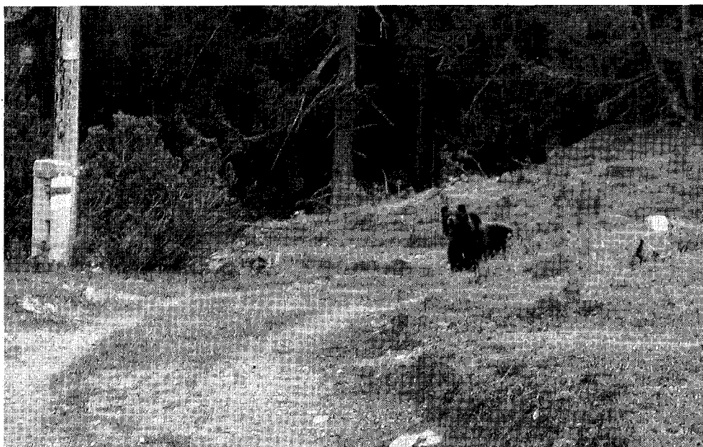
Und plötzlich ist er wieder da – junger Bär auf dem Ofenpass am 1. August 2005.

Unterstützung erfährt das Bären-Konzept hingegen von den Tier- und Naturschutzorganisationen. Pro Natura ist überzeugt, dass ein konfliktfreies Zusammenleben von Mensch und Bär auch hierzulande möglich ist. Zentraler Punkt sei dabei, dass die Bevölkerung informiert werde, wie sie sich dem Bären gegenüber korrekt zu verhalten habe. Der WWF begrüsst die schnelle Reaktion des Bundes auf die Einwanderung des Braunbären ins Bündnerland. Er vermisst aber im Konzept eine klare Strategie für die Öffentlichkeitsarbeit. (cvb/ap)