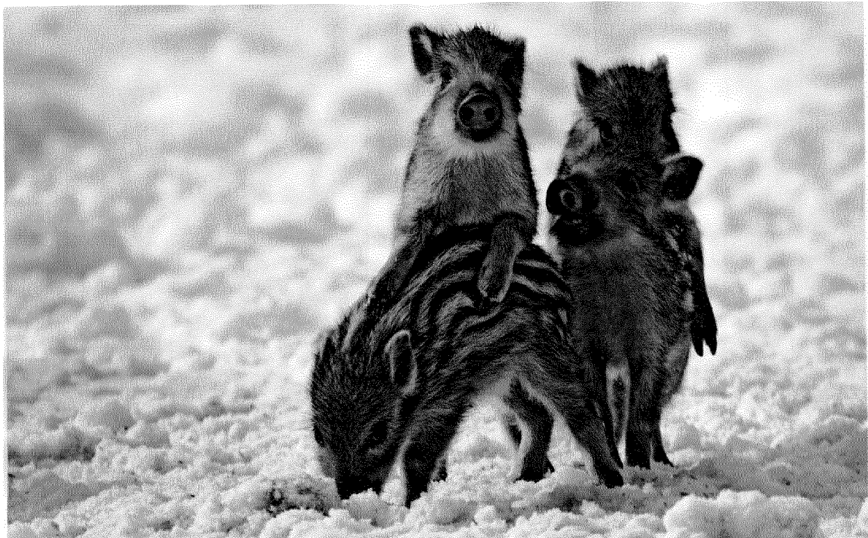
Suche nach neuen Nahrungsquellen: Junge Wildschweine.

Lieferschein Nr.: 3926391 Medien Nr.: 1378 Medienausgabe Nr.: 713638 Objekt Nr.: 18557810 Subobjekt Nr.: 6 Lektoren Nr.: 2 Abo Nr.: 1067498 Treffer Nr.: 29499734