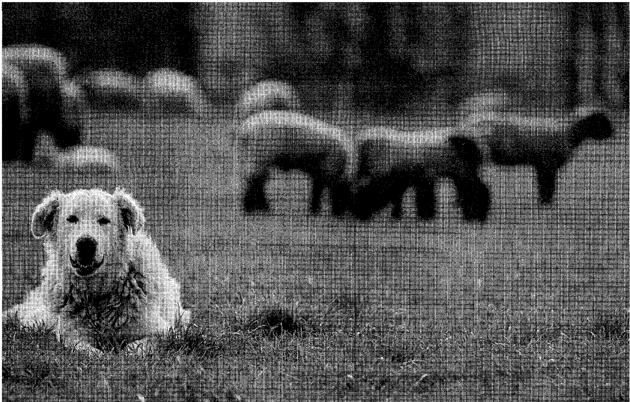
Auch ein Hund der Rasse Maremma Abbruzzese garantiert keinen 100-prozentigen Schutz vor dem Wolf.